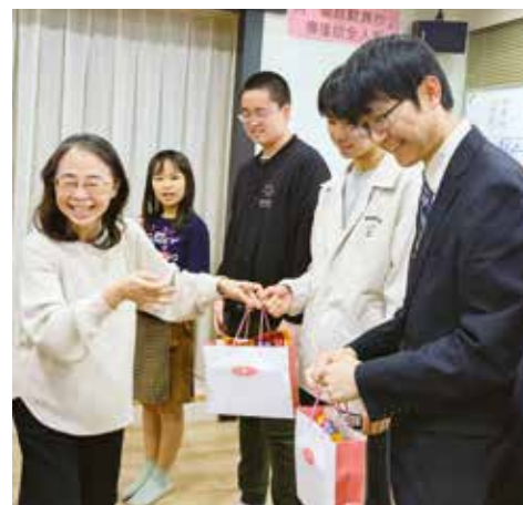
日本學徒送上一份充滿驚喜的感謝禮物。

在二十九日當天的學習會上，親友部的石村賢治先生介紹了東野圭吾的小說《白夜行》的梗概。這部描寫了當舖殺人事件的加害者女兒和被害者兒子的殘酷半生的故事，讓會場陷入了深深的寂靜之中。