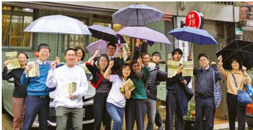
在雨中的台北市內，發放了三千張傳單。

三月下旬，日本的年輕學徒訪問台灣，與當地學徒進行了深入交流。除了佛法學習會和發傳單之外，還舉辦了以人氣小說《白夜行》為題材的學習會。這成為了重新深刻體會親鸞聖人所說的「惡人正機」的真意，以及佛緣之寶貴的機會。