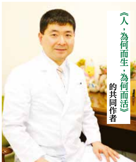
《人，為何而生，為何而活》 的共同作者

這讓他開始思考：「人為什麼不能自殺？」、「人為什麼活著？」這不僅是病人的問題，也是醫師必須面對的生命課題。