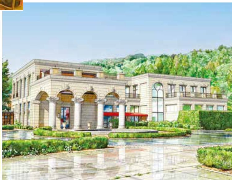
前方的A棟一樓除了設有講堂，也設有不必換鞋、可直接進入的咖啡廳等設施。