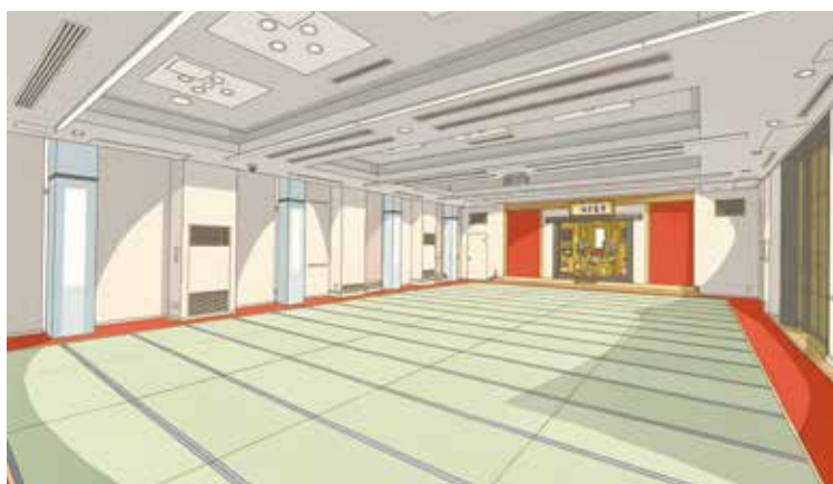
A棟一樓預計將設置專門用於認真聽講佛法的講堂。