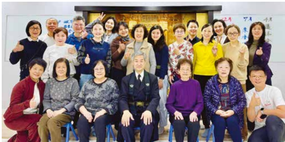
第一次法話會紀念合照。