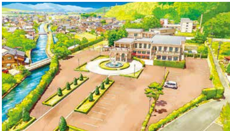
富山紫雲閣佔地廣達五千坪，並設有可容納一百五十輛車的停車場。