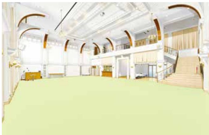
C棟的主廳鋪滿了淡綠色的地毯，預計將作為格調高雅的大禮堂使用。室內採用無柱式的寬敞設計，最多可讓兩位賓客同時在此聚餐。