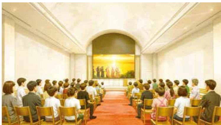
B棟二樓的影院劇場空間寬敞且具備開放感，最多可容納約一百人。