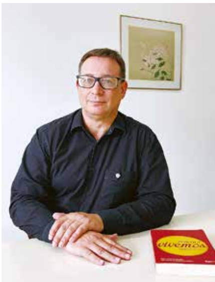
右邊是葡萄牙語版《人，為何而生，為何而活》