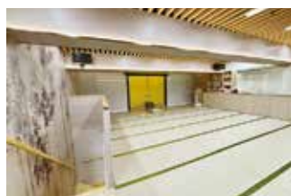
講堂內鋪滿了舒適的榻榻米。