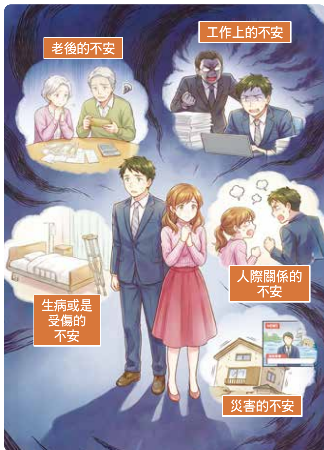
雖然我們渴望安心地生活，但人生卻充滿不安。

會擔心「萬一大火延燒到自己家，也陷入一片火海的話該怎麼辦」，像這樣感到不安。在這個時候，不會有人悠哉地說「我吃飯吃到一半，等吃完了再逃吧」或是「等我看完這一集電視劇，再來準備滅火」。