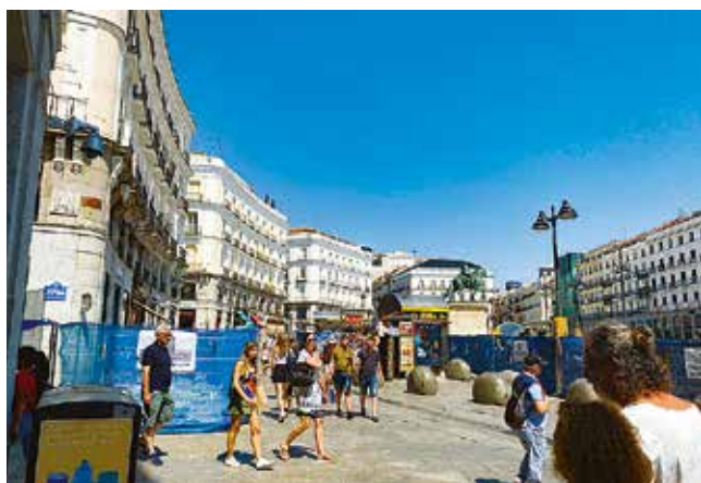
西班牙的人口不到五千萬，有三百二十萬人居住在首都馬德里。圖為太陽門(Puerta del Sol)，馬德里市中心的一個廣場。