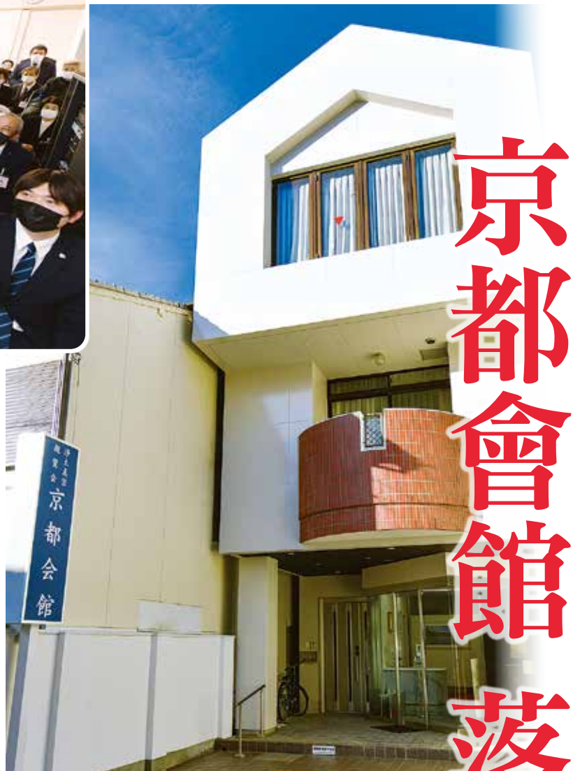
臨近京都市的繁華街道，五層樓高的法城。 從正面看第一講堂就在三樓向前突出的部分。