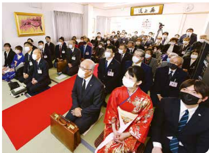
於落成慶典期間，三樓第一講堂坐滿了京都等地的各方學徒。