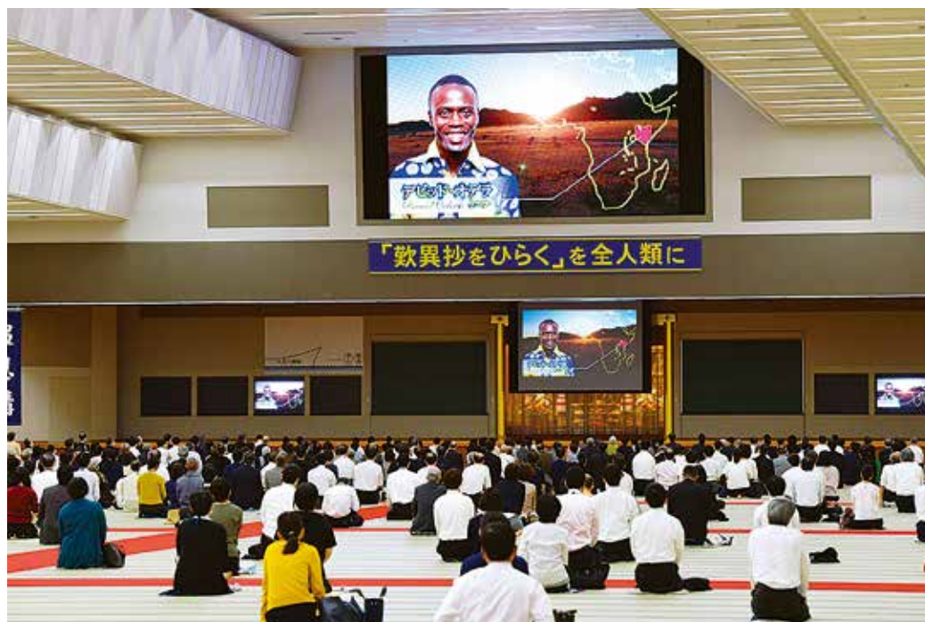
在開幕影片中，介紹了非洲中東部的國家肯亞的大衛也要向他的國家的人們傳播《歎異抄》中記載的真正的幸福。