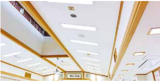
配備了LED照明。(二樓講堂)

了苦惱無邊無際的人的實相，以及苦惱的原因唯有疑情這一個。 落成典禮的情況通過網絡向富山縣的其他會館等地進行了現場直播。為慶祝高岡會館重新出發，許多學徒都參加了該典禮。新會館位於交通便利的市區，距離高岡站只有十分鐘的路程。從主要道路轉進來，就能看到一個藍色的標誌「高岡會館」。鋪設好的停車場，可停泊約四十輛汽車，會館的外牆為清新的淡綠色。 此外還有一個可容納三輛大型巴士的車庫以及別館。 館內全部配備了LED照明和最