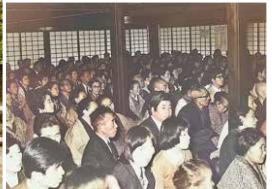
一百張榻榻米的本堂從搬遷法要開始就座無虛席。(一九七四年)