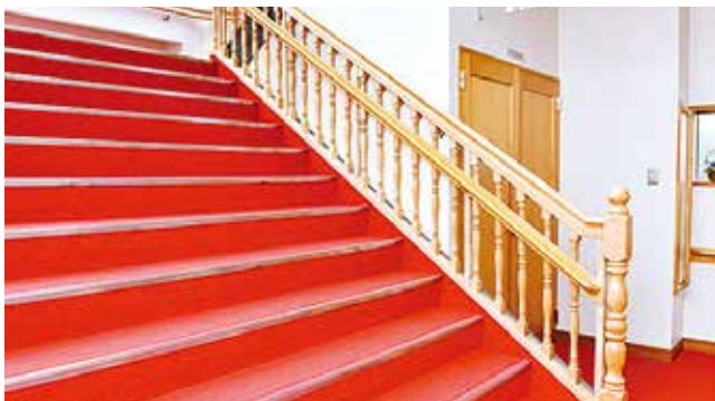
考量到長者的使用方便，樓梯分別有高低兩段。

新的空調系統，以舒適的環境迎接前來聞法的人。考量到長者的使用方便，樓梯分別有高低兩段。廁所是西式的，有免治馬桶。考慮得非常周到。 為了防疫考量，讓在二樓講堂舉行的法話也同時可以在一樓的第一會議室聽聞，因此特別安裝了一個系統，以確保視頻傳輸的流暢性。而且還安裝了最適合上網的最新設備，讓即使完全沒有經驗的人，也易於完成網絡傳送的操作。大滝館長說： 「希望與盡可能多的人分享這種幸福。為了讓附近的人結上尊貴的佛緣，今後打算舉辦上映會等活動」。