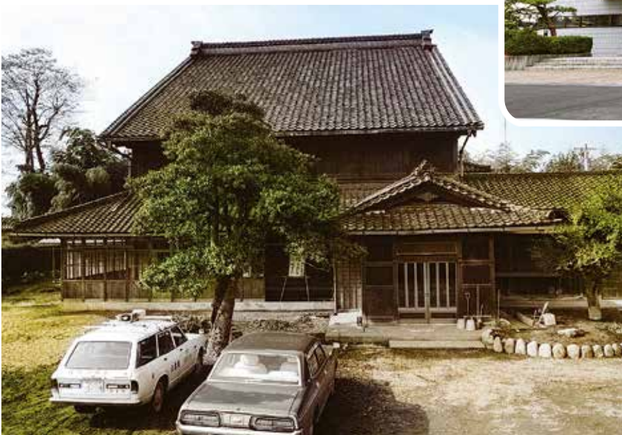
一九七四年，總部搬到了高岡市吉野的一個前運輸船商的豪宅裡。