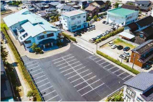
從上空看新・高岡會館。

了苦惱無邊無際的人的實相，以及苦惱的原因唯有疑情這一個。 落成典禮的情況通過網絡向富山縣的其他會館等地進行了現場直播。為慶祝高岡會館重新出發，許多學徒都參加了該典禮。新會館位於交通便利的市區，距離高岡站只有十分鐘的路程。從主要道路轉進來，就能看到一個藍色的標誌「高岡會館」。鋪設好的停車場，可停泊約四十輛汽車，會館的外牆為清新的淡綠色。 此外還有一個可容納三輛大型巴士的車庫以及別館。 館內全部配備了LED照明和最