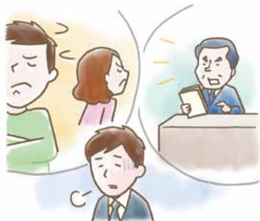
無論在家裡還是職場，心都無法放鬆。

即使在相較於大家庭不太受拘束的小家庭，夫婦之間的爭吵也無法完全避免；鄰里之間的糾紛也時