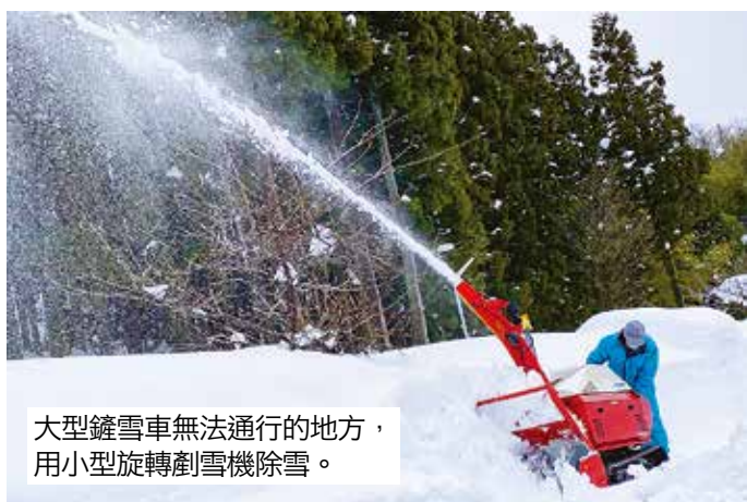
大型鏟雪車無法通行的地方， 用小型旋轉剷雪機除雪。