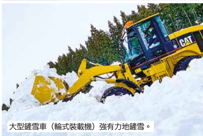
大型鏟雪車（輪式裝載機）強有力地鏟雪。