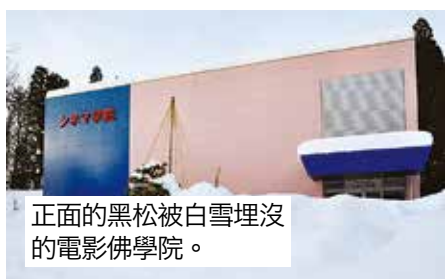
正面的黑松被白雪埋沒 的電影佛學院。