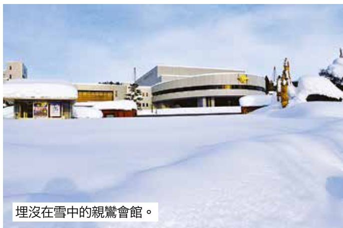
埋沒在雪中的親鸞會館。