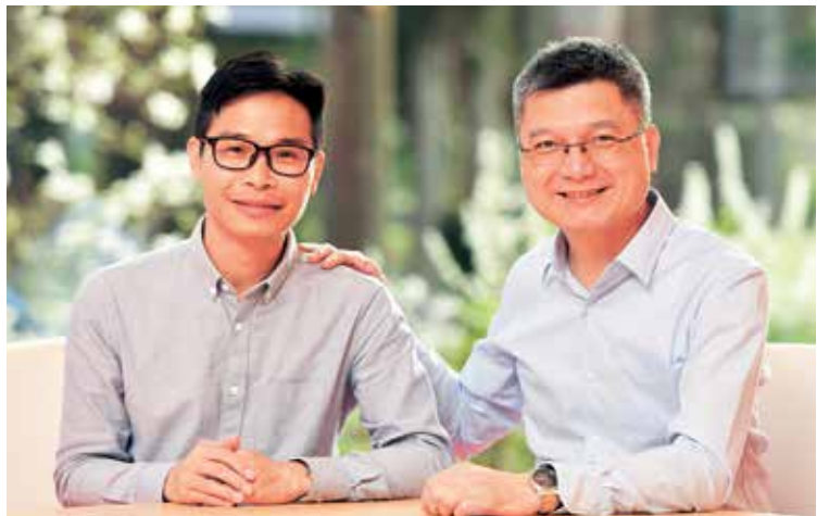
工作單位的午休是法施的時間 帶水務局的同事到兩千張

他非常清楚開顯真實是一條艱難的道路，但是夫妻倆富有使命感地說：「正因如此，才要向前。」