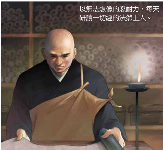
以無法想像的忍耐力，每天研讀一切經的法然上人。