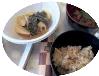
竹筍飯和味噌煮竹筍。