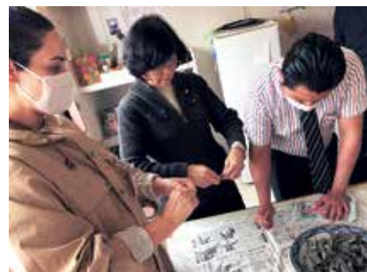
細心地用手指將沾在「竹筍昆布」上面的鹽分和砂子去除。

「正如將澀味原原本本變為甜味一樣，親鸞聖人以和讚 「罪障成為功德體，恰可喻為冰與水，冰若多則水亦多，障若多則德亦多。」 表達了被阿彌陀佛拯救的妙境，為這將欲望和憤怒等煩惱，轉為了絕對的幸福之不可思議而感到無限歡喜」。