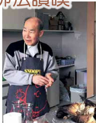
吉村總長親自去掉竹筍皮。先將竹筍頂部切掉，再用刀垂直切開後、去皮。