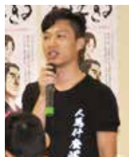
人群中，一張一張地發法會的宣傳單。而現在，他的目標是成為親鸞講師。

不久，他成為了親鸞學徒，有了很大的成長。遇法的歡喜越大，傳法的心也會越強。他身穿親手做的印有「人為什麼活著」的T恤，在霓虹燈閃耀的香港夜晚，穿梭在步履匆匆的