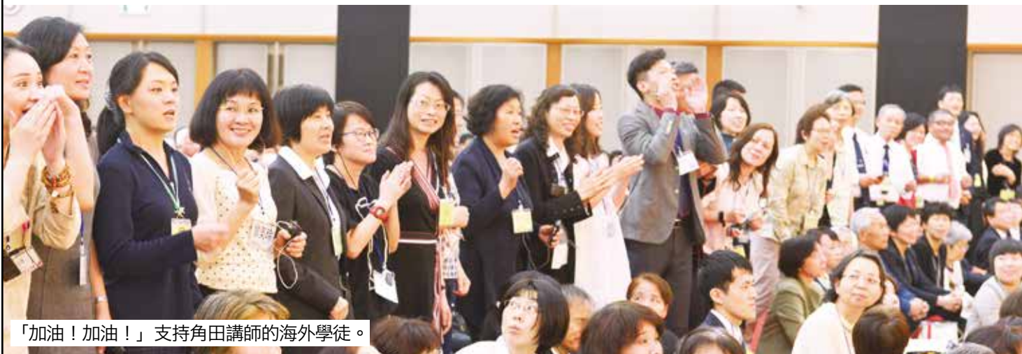
「加油！加油！」支持角田講師的海外學徒。

最後決戰已經正式開始了。我們現代的親鸞學徒決不能輸給八百年前、五百年前的同朋們。善知識的……只要是善知識的指示（命令），我們的回答就是「聽命」。