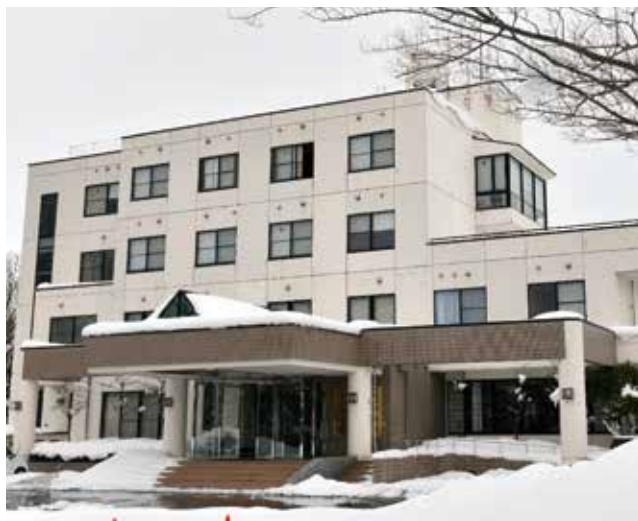
法輪閣（富山縣射水市）