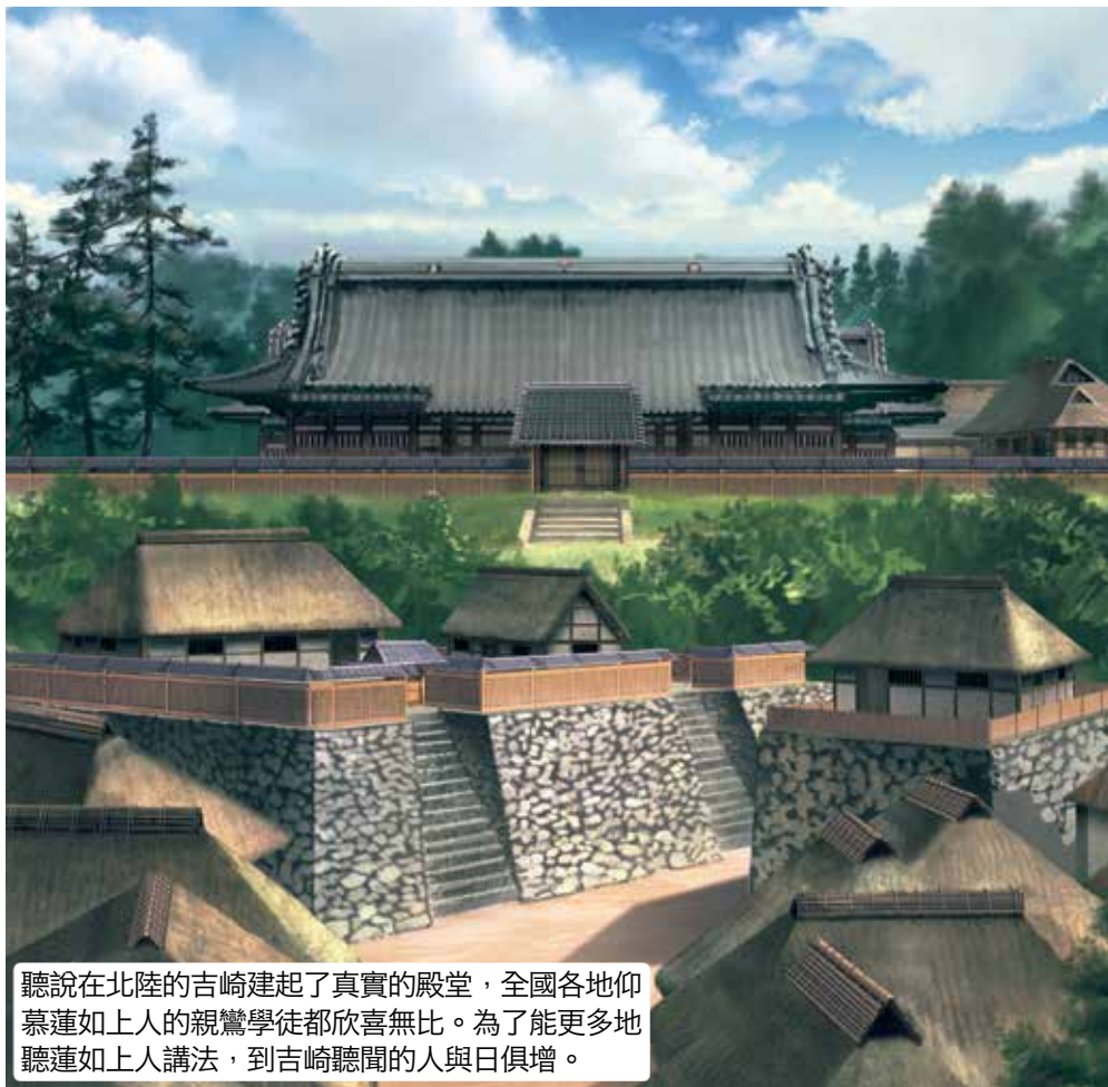
聽說在北陸的吉崎建起了真實的殿堂，全國各地仰慕蓮如上人的親鸞學徒都欣喜無比。為了能更多地聽蓮如上人講法，到吉崎聽聞的人與日俱增。

文明三年（一四七二），十七歲的蓮如上人將弘法據點轉移到北陸地區，來到了越前（今福井縣）的吉崎。