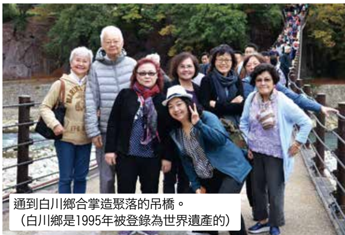
通到白川鄉合掌造聚落的吊橋。 (白川鄉是1995年被登錄為世界遺產的)