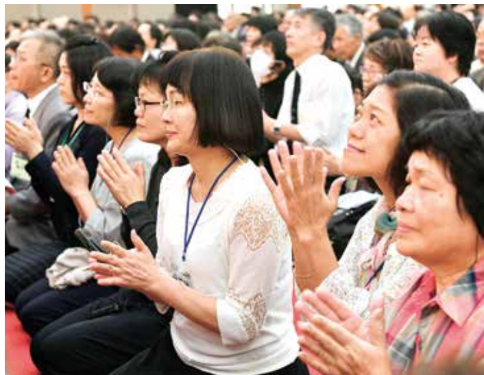
聽到游講師的發表而感動涕零的法友。

嘉義出身的一介年輕學徒，立志「成為在台灣傳達親鸞聖人教義的橋樑」，努力克服學習日語的障礙成為了講師，在演講大會的大舞台上獲得優勝。聽法多年的資深學徒眼泛淚光地說：「我一直在等待著這一天。」對於迅速擴展的台灣法輪，會場送上滿堂的喝采掌聲。