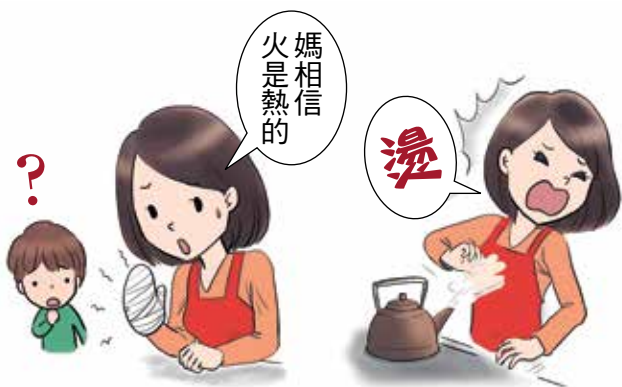
被火燒傷的人不會說「我相信火是熱的。」

關於這個被拯救的世界、有高森老師在兩千張為我們明確地闡明。而我們為了乘上大悲願船，唯有專心致志地聽聞本願，因此就必須在兩千張聞法。