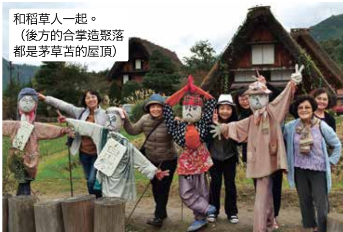
和稻草人一起。 (後方的合掌造聚落都是茅草苫的屋頂)