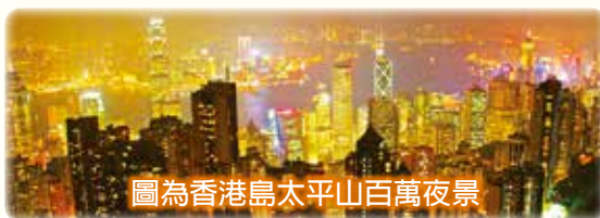
圖為香港島太平山百萬夜景