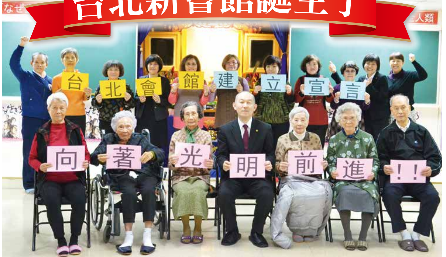
籌備台北新會館的紀念合影。 新會館位於台北市士林區，預計於八月份裝修完成。