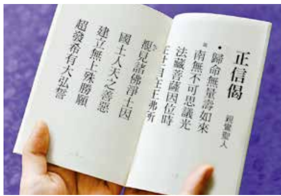
這是記載著《正信偈》全文的正信聖典。(有中文版和日文版)