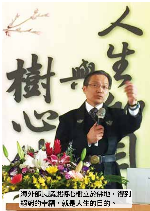
海外部長講說將心樹立於佛地，得到絕對的幸福，就是人生的目的。