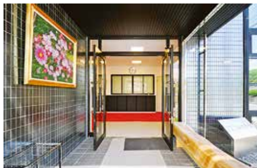
寬闊的玄關溫暖地迎接著法友們。木頭的座椅，是聖地課使用同朋之里的杉樹所製作。