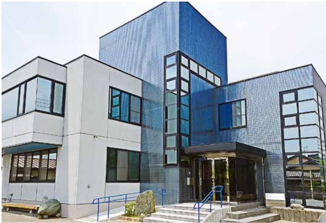
山口會館是採用了許多玻璃帷幕的設計的三層樓建築。位於國道190號沿線。