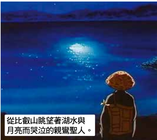
從比叡山眺望著湖水與月亮而哭泣的親鸞聖人。