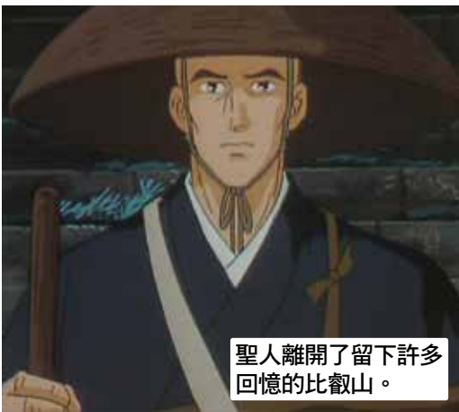
聖人離開了留下許多回憶的比叡山。

親鸞聖人年僅9歲就出家人佛門，此後的二十年當中，專心致力於異常艱苦的難行苦行，卻無法解決後生黑暗之心。聖人對於天台宗的教義感到絕望決心下山。關於他當時的苦惱，在《歎德文》* 這本著作當中有這樣一段記載。