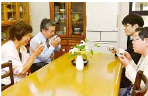
山口會館一樓的廚房餐廳。聽法之後，可以在這裡稍微放鬆休息一下。

將親鸞聖人的教義用四個字表示出來，那就是「平生業成」。「平生」是說，「不是在死後，而是現在活著的時候」。「業成」的意思是「人生的大事業得以完成」。人生的大事業（人生目的）是乘上大悲願船，愉快地渡過痛苦波濤洶湧不絕的人生苦海，得到「生而為人真好」的生命喜悅，活在未來永恆的幸福裡。