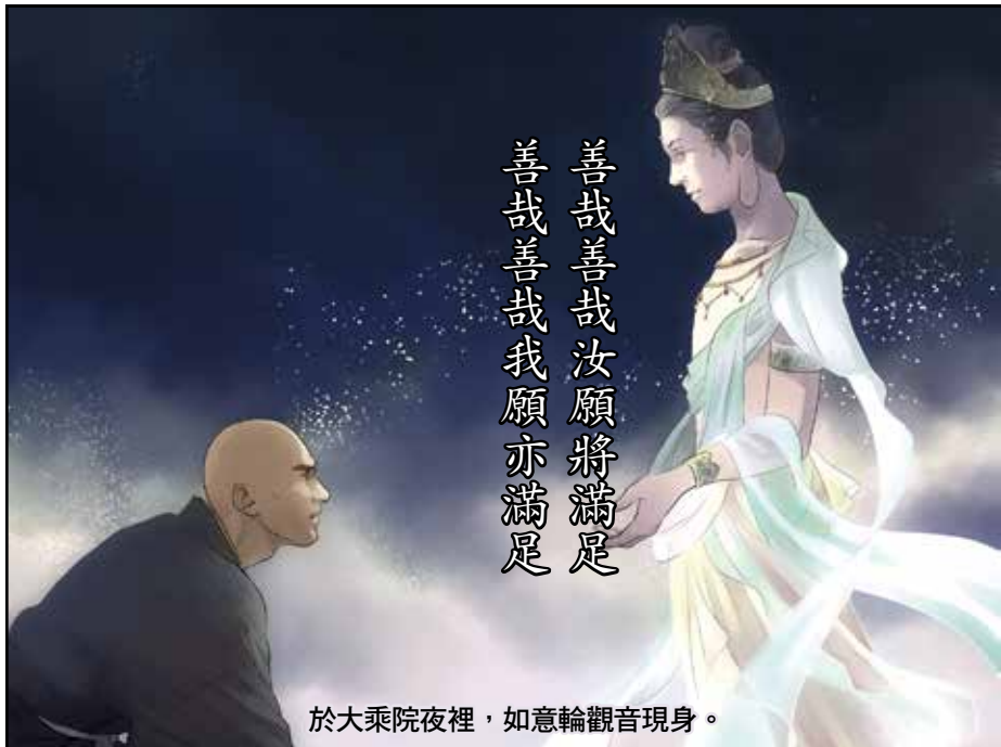
於大乘院夜裡，如意輪觀音現身。