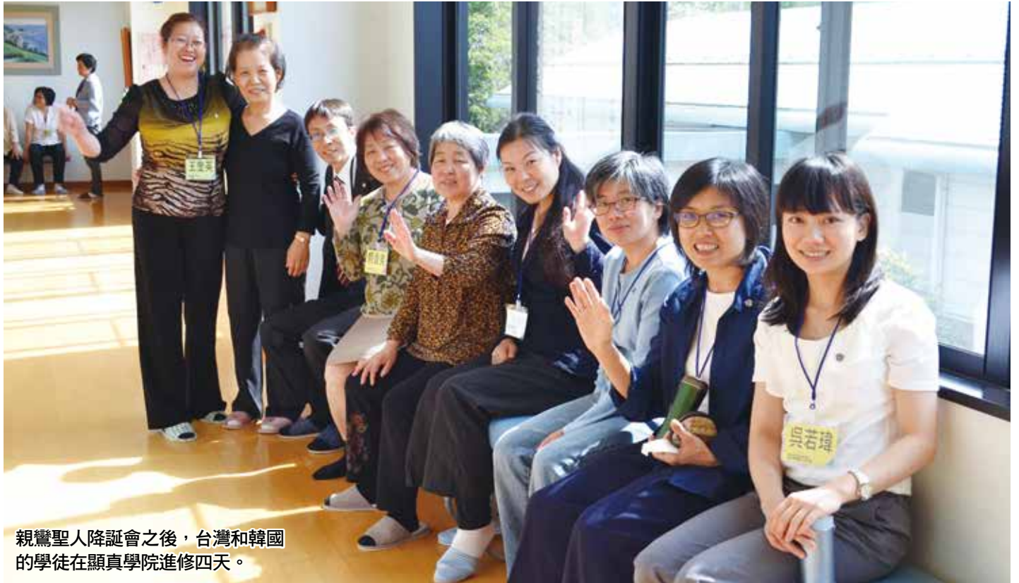
親鸞聖人降誕會之後，台灣和韓國的學徒在顯真學院進修四天。