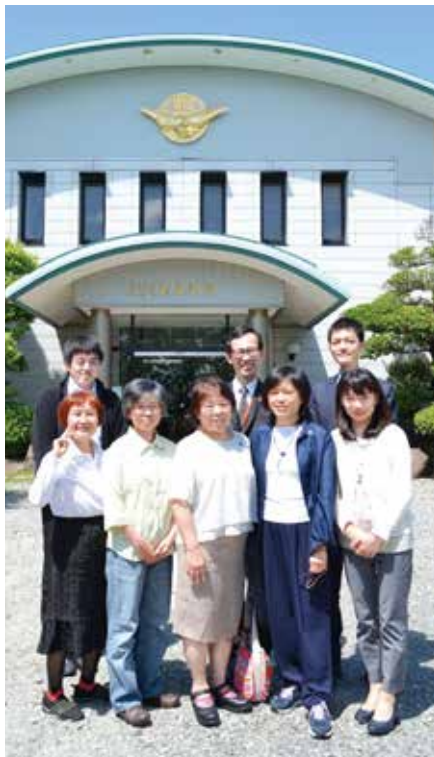
為了達成人生的目的，團結是非常重要的。大家在顯真學院裡學習了遵守時間和信守諾言等維持團結的基本原則。