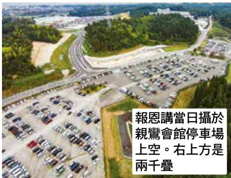
於攝場是上方右。是停車場。當館會親。日講親。恩報。兩千疊。

前幾天連休的時候，有一對夫婦帶著兩個幼小的孩子一起乘船垂釣。孩子們玩得忘情，不小心掉到了河裡。父親慌忙地跳進水中，救起了兩歲的兒子，但是四歲的女兒卻沉到了河底，被發現時早已沒有了呼吸。期待已久的全家旅行，一下子變成了愛女的守靈之夜。