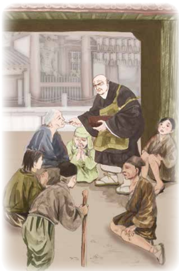
明遍夢見了一位尊貴的僧侶。

* 解脫房貞慶：南都（奈良）佛教的代表者。聖道門各宗派害怕淨土宗的迅速發展，產生了強烈的危機感。元久二年（一一〇五年），貞慶起草《興福寺奏狀》列舉法然教團的九項過失。