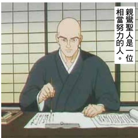
親鸞聖人是一位相當努力的人。