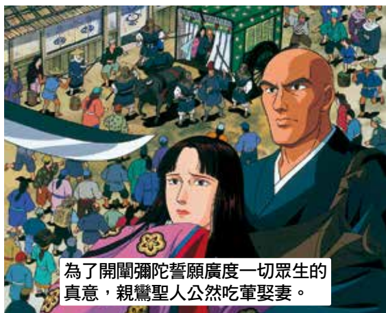
為了開闡彌陀誓願廣度一切眾生的真意，親鸞聖人公然吃葷娶妻。

親鸞聖人在三十一歲的時候，由於法然上人的推薦，斷然決定吃葷娶妻。據說，他結婚的對象是當時的關白九條兼實的女兒——玉日姬。九條兼實做為法然上人虔誠的信奉者而知名，他在輔佐天皇的同時，與武家政權的源賴朝*也有著深厚的交情，身居當時日本政界的權力頂峰。