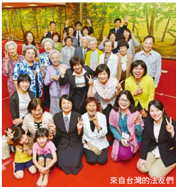
來自台灣的法友們