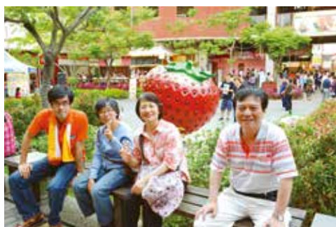
羅東桃園的法友，開心遊玩草莓文化館