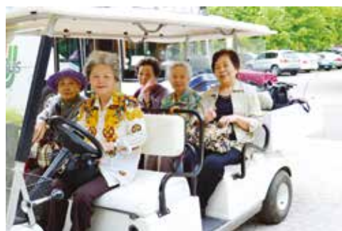
花露民宿的迎賓車，很舒適！