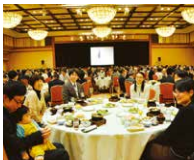
各地法友增進感情，氣氛和樂

在東京，也有一位六十多歲的主婦，感動於親鸞聖人「 渡難渡海大船 」的話語。她心想，要怎麼樣才能乘上大船，於是在書店購買了『人2』，仔細閱讀之後反覆地說：「原來是這樣啊。我清楚明白了。」詢問她為什麼讀一次就直覺性