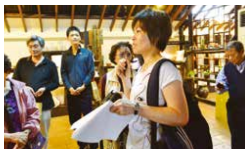
在民宿賣店呼籲大家，不要買太多及聯絡事情