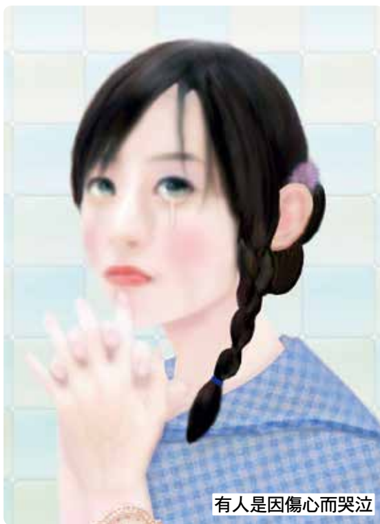
有人是因傷心而哭泣