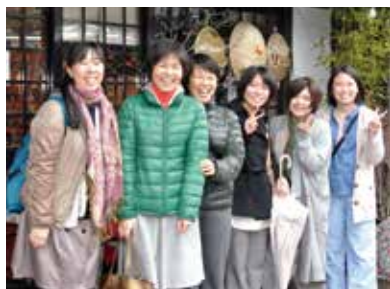
從北陸來的遊覽車，途中在白川鄉休息

在北海道的釧路，一位六十幾歲主婦在車上聽到『人，為何而生，為何而活』的朗讀廣播，心想「就是這個！」而跑去買了書。之後，她參加了本會的演講演，也購買了『人2』。她說：「人為什麼活著，這六個字直截了當，真的很不得了。」