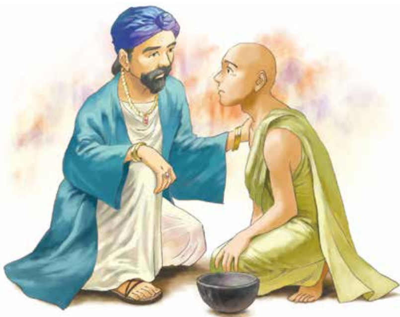
非常同情修行者的富豪，親切地提出要供養修行者和他的師父的食物