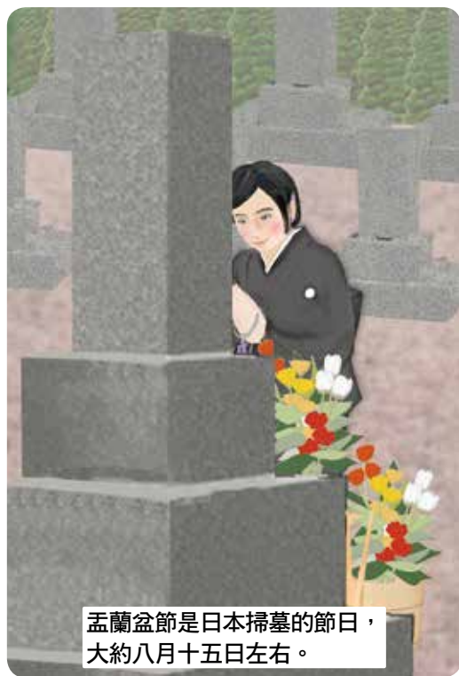
孟蘭盆節是日本掃墓的節日，大約八月十五左右。