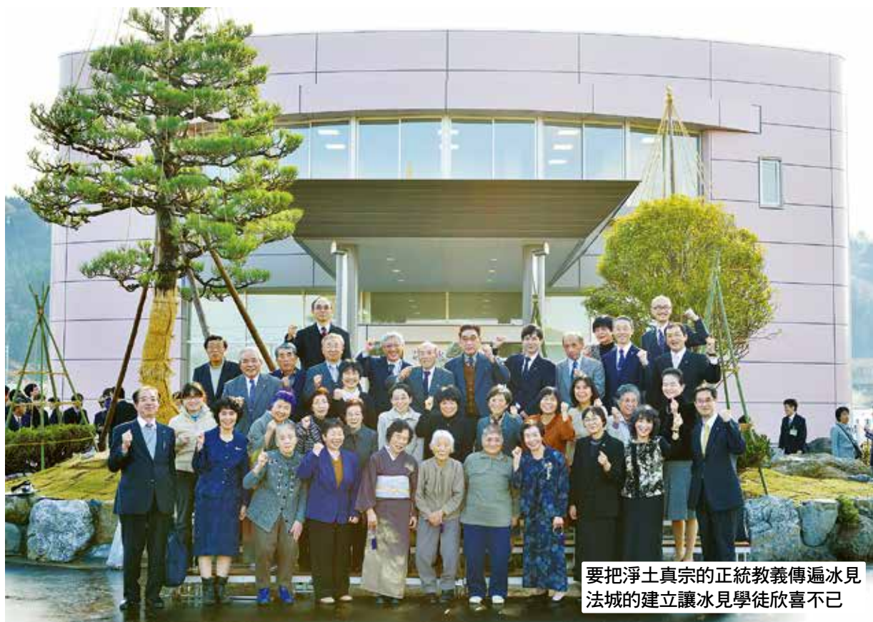
要把淨土真宗的正統教義傳遍冰見法城的建立讓冰見學徒欣喜不已