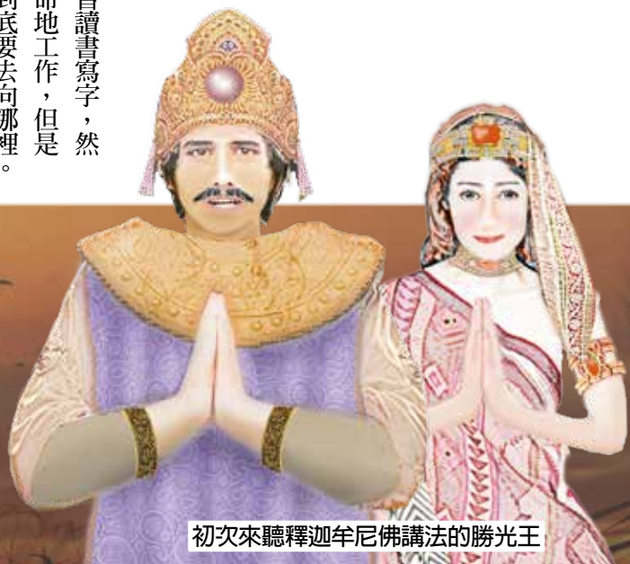
初次來聽釋迦牟尼佛講法的勝光王