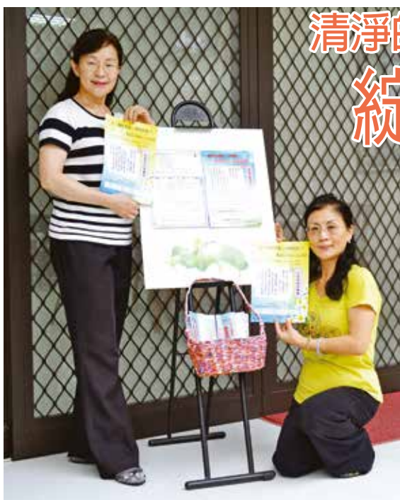
在玄關設置了展示板。籃中擺放的宣傳單任何人都可以自由拿取

『阿彌陀經』告訴我們，在阿彌陀如來的極樂淨土裡，有青色、黃色、赤色和白色的蓮花，蓮花會放射出奇妙的光彩，散發出清幽的香氣。和蓮花同名的「花蓮會館」，正如蓮花所象徵的意義一樣，這完全是無上佛為了拯救台灣的人們而賜予的「南無六字之城」。