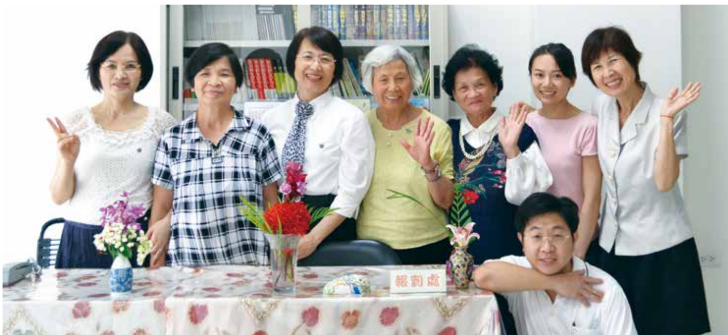
進門左手邊的報到處。 「來來來～歡迎大家到花蓮會館來！」