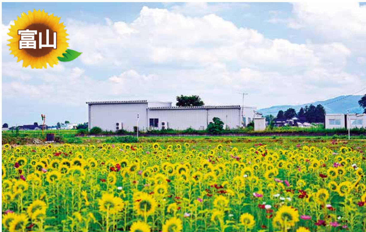
出現在礪波平原的散居村落中的南礪東會館