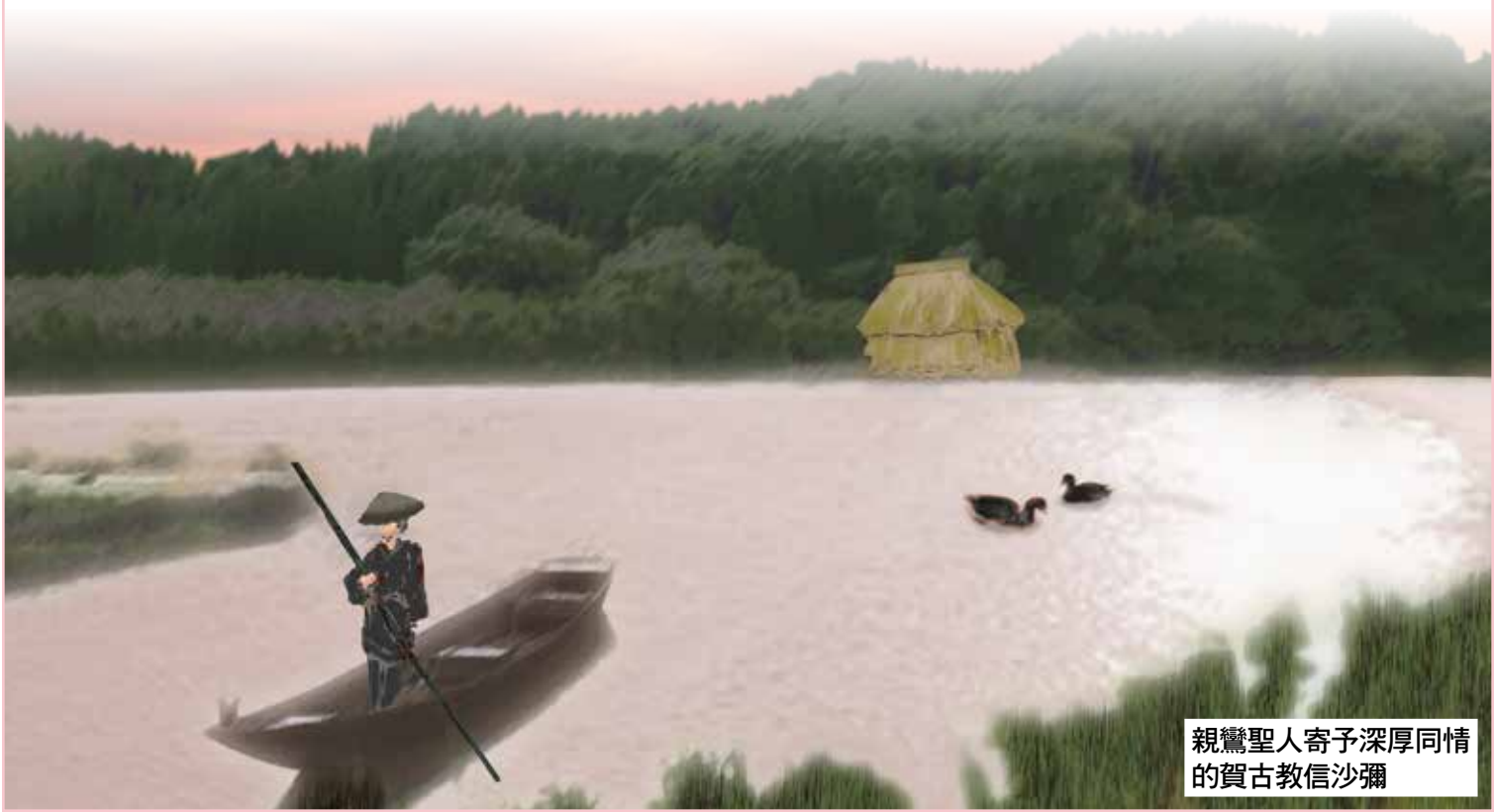
親鸞聖人寄予深厚同情的賀古教信沙彌