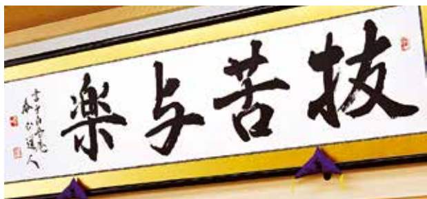
懸掛在島根會館的「拔苦與樂」匾額 (書法名家木村泰山先生 撰書)