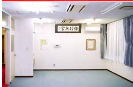
一樓的護理站搖身一變成為會議室。在這裡也可以作為可容納多人的用餐室