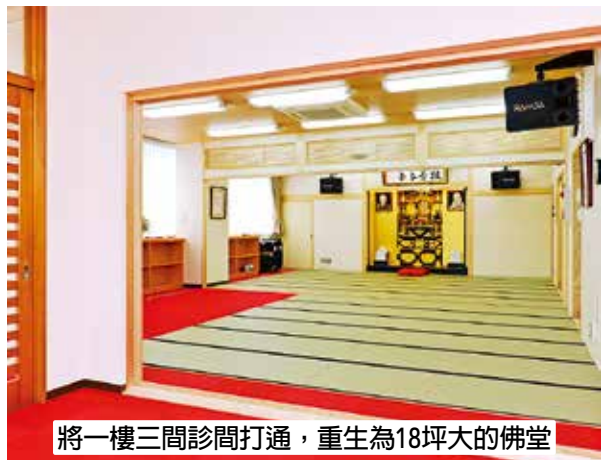
將一樓三間診間打通，重生為18坪大的佛堂